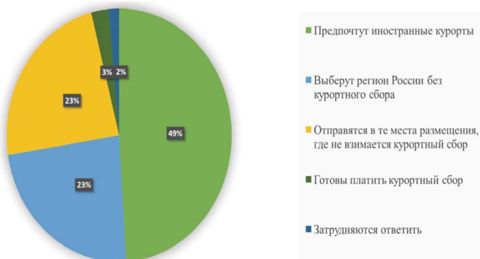
Рисунок 1 – Результаты опроса о введении курортного сбора

В связи с неготовностью туристов платить данный сбор, существует ряд угроз, которые могут возникнуть при введении курортного сбора. Во-первых, может произойти увеличение процента отдыхающих в частном секторе, где налог не взимается. Во-вторых, многие представители туристского бизнеса высказываются против нововведения. Среди