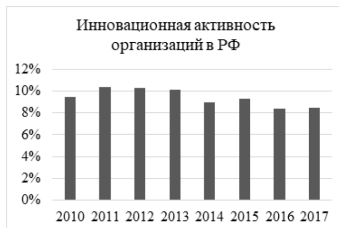
Рис. 1. Инновационная активность организаций в Российской Федерации

ганизации, совершенствование продукции для поддержания высокого уровня конкурентоспособности. Исследования показывают, что инновационная активность организаций (организации, осуществляющие технологические, организационные, маркетинговые инновации) в Российской Федерации по состоянию на конец 2017 года составляет 8,3% (рис. 1).