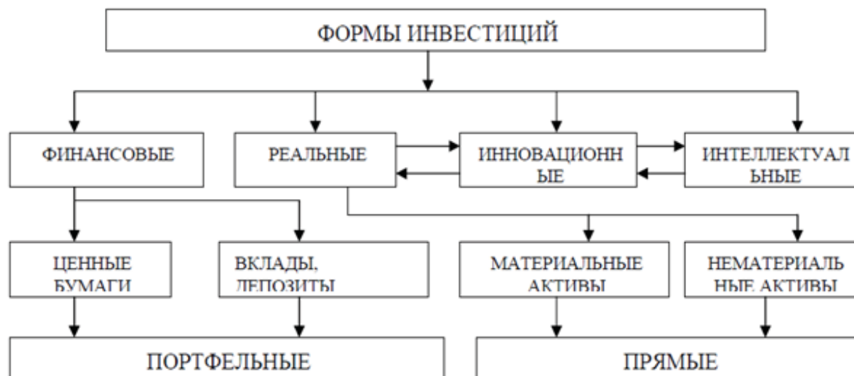
Рис. 1. Классификация форм инвестиций по А. Пересаде

Инвестиционная деятельность предприятия – то, чем осуществляется инвестирование. Также есть