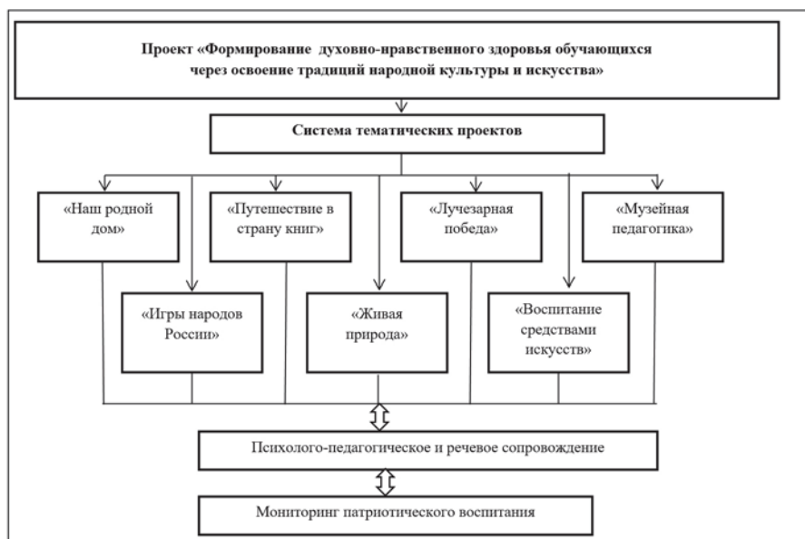
Рисунок 1. Структура проекта

Проект представляет собой систему взаимосвязанных тематических проектов, являющихся его неотъемлемой частью, объединенных единой Концепцией проекта и направленных на достижение общих целей проекта. Структура проекта представлена на рисунке 1.