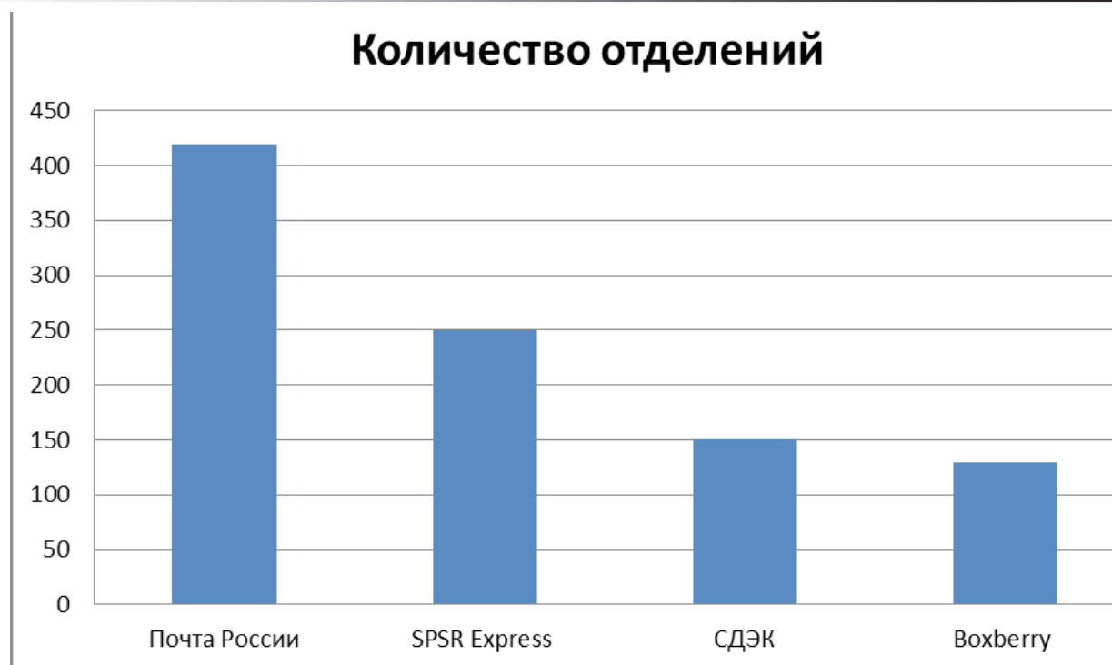
Рисунок 1. Система отделений

Что касается количества отделений представленных на рисунке 1, то «Почта России» является абсолютным лидером в данном направлении, располагая 41901 отделением.